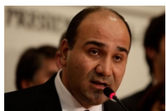
Juan Luis Manzur

"La salud no tiene fronteras, los límites con los países vecinos son sólo geográficos", afirmó el funcionario, y agregó: "Hace una semana estuvimos trabajando en la zona de la Triple Frontera y hoy lo estamos haciendo con todos los ministros del país en Formosa".